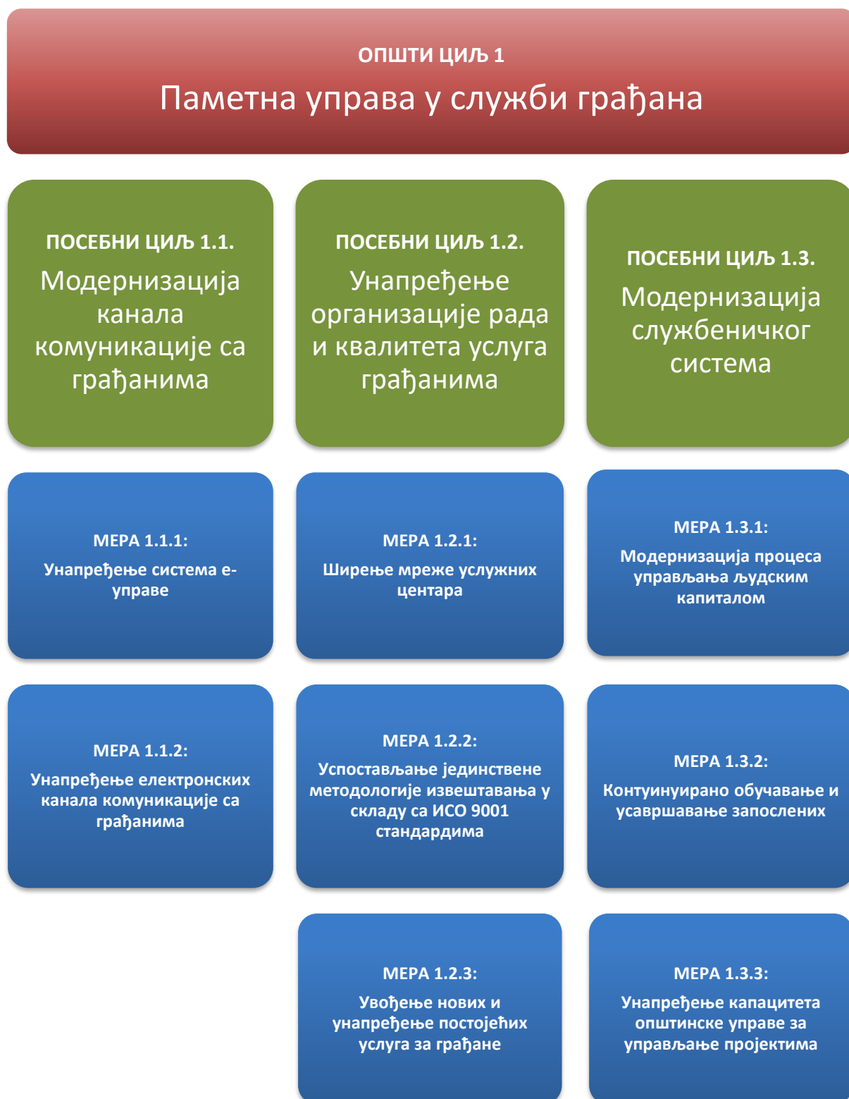
Слика 1: Посебни циљеви и мере за циљ „Паметна управа у служби грађана“

Ефикасан и транспарентан рад ГО Чукарица који, са употребом информационих и комуникационих технологија, подстиче максималну укљученост грађана у доношење важних одлука и пружа свима релевантне информације кроз различите медије и формате информисања, оствариће се кроз следеће посебне циљеве и мере: