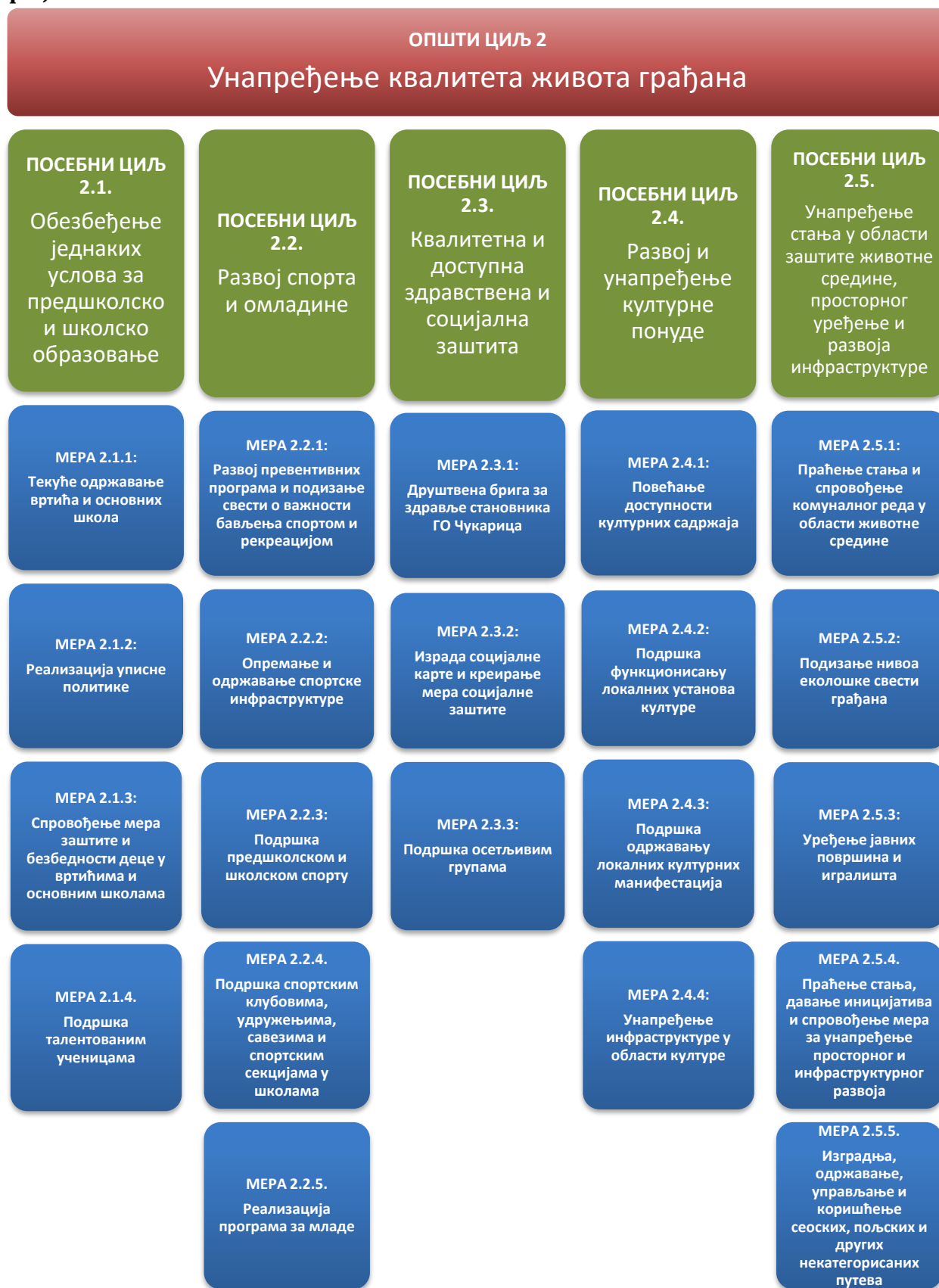
Слика 3: Посебни циљеви и мере за општи циљ „Унапређење квалитета живота грађана“